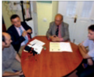
■ Acto de la firma del convenio.

La Oficina de Software Libre de la UCA y el CPD del Ayuntamiento de San Roque designarán a las personas encargadas del cumplimiento del acuerdo de colaboración, evaluando su aplicación, promoviendo líneas de acción comunes y adoptando medidas para su adecuado desarrollo.