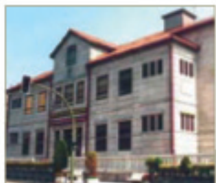
■ Centro Cultural de O Porriño.

El Concello de O Porriño ha instalado Software Libre en la mayor parte de los ordenadores del Centro Cultural Municipal. Con esta medida se pretende difundir entre los ciudadanos los sistemas operativos y programas que se caracterizan por ser gratuitos y de libre distribución.